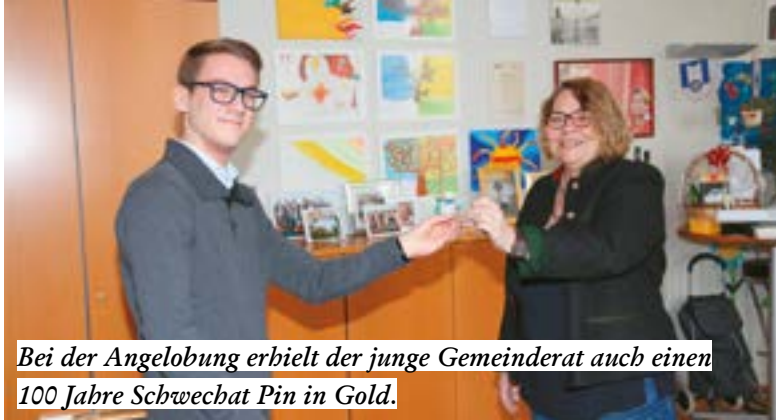
Bei der Angelobung erhielt der junge Gemeinderat auch einen 100 Jahre Schwechat Pin in Gold.