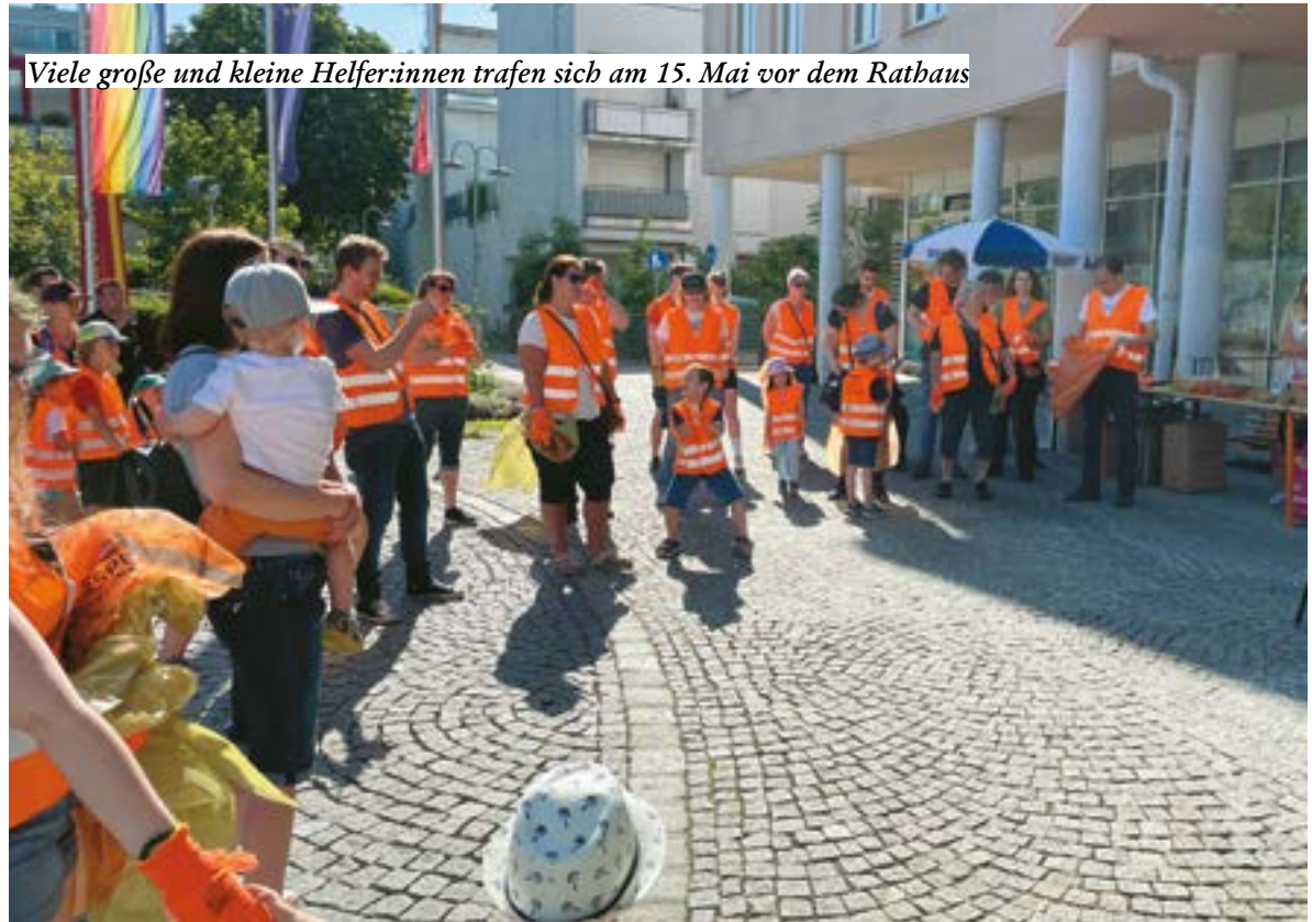
Viele große und kleine Helfer:innen trafen sich am 15. Mai vor dem Rathaus

Am Sonntag, dem 15. Mai fand in Schwechat eine Flurreinigung statt. Darunter versteht man das Sammeln und Entsorgen von Abfällen die bewusst oder unbewusst in die Natur gelangt sind. Vor dem Rathaus holten sich die freiwilligen Helfer:innen Hilfsmittel wie Müllsäcke, Handschuhe und Warnwesten ab und zogen anschließend los, um Schwechat von dem liegengebliebenen Müll zu befreien. Besonders an der Schwechat und auf den Spielplätzen, gab es besonders viel zu tun.