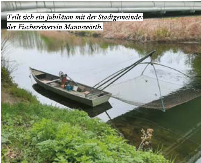
Teilt sich ein Jubiläum mit der Stadtgemeinde: der Fischereiverein Mannswörth.

Als vor mehr als einhundert Jahren der erste Fischer seine Daubelhütte irgendwo am Ufer des Donastroms errichtete, wusste er nicht, dass er die Tür zu einer großen Geschichte aufstieß, die Geschichte der Daubelfischer.