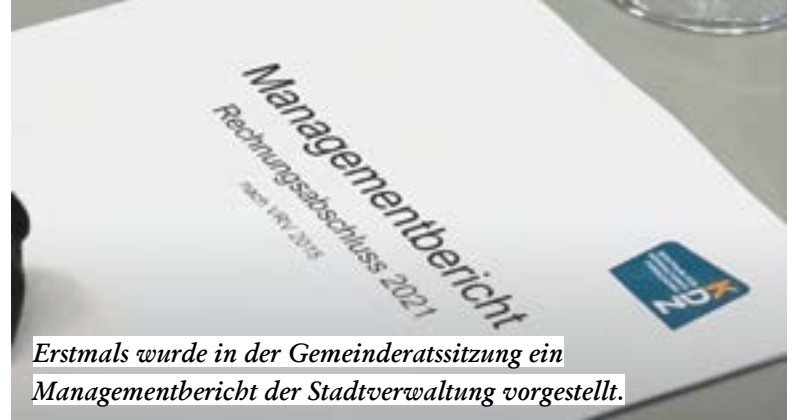
Erstmals wurde in der Gemeinderatssitzung ein Managementbericht der Stadtverwaltung vorgestellt.

Der Schwechater Gemeinderat genehmigte mit den Stimmen von SPÖ, FPÖ, Neos und GfS vor Ostern den Rechnungsabschluss für das Jahr 2021. Die ÖVP stimmte dagegen, die Grünen enthielten sich.