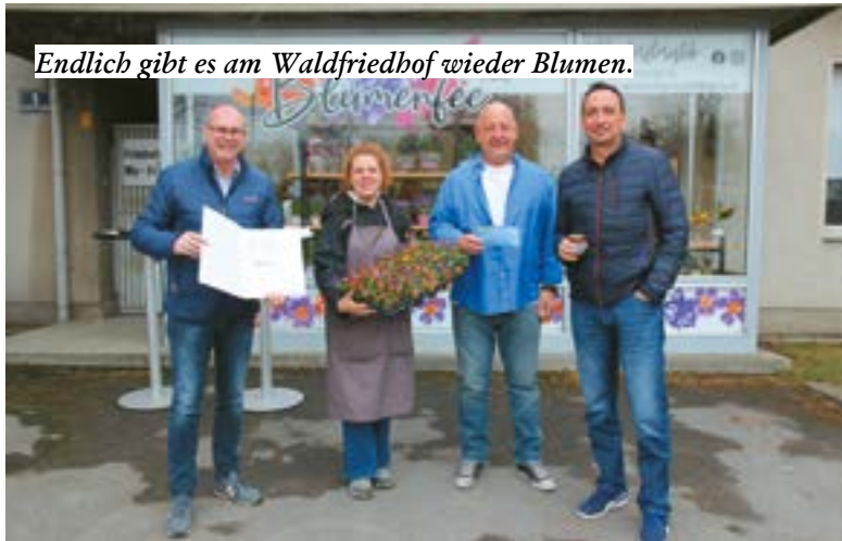
Endlich gibt es am Waldfriedhof wieder Blumen.