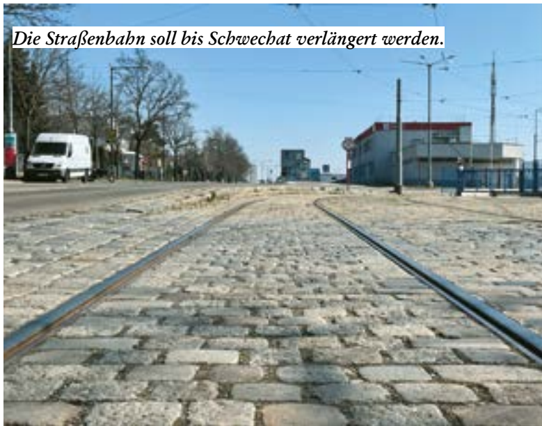
Die Straßenbahn soll bis Schwechat verlängert werden.

Am Freitag, dem 18. März fand eine Pressekonferenz der Länder Niederösterreich und Wien zum Thema Straßenbahnverlänge-