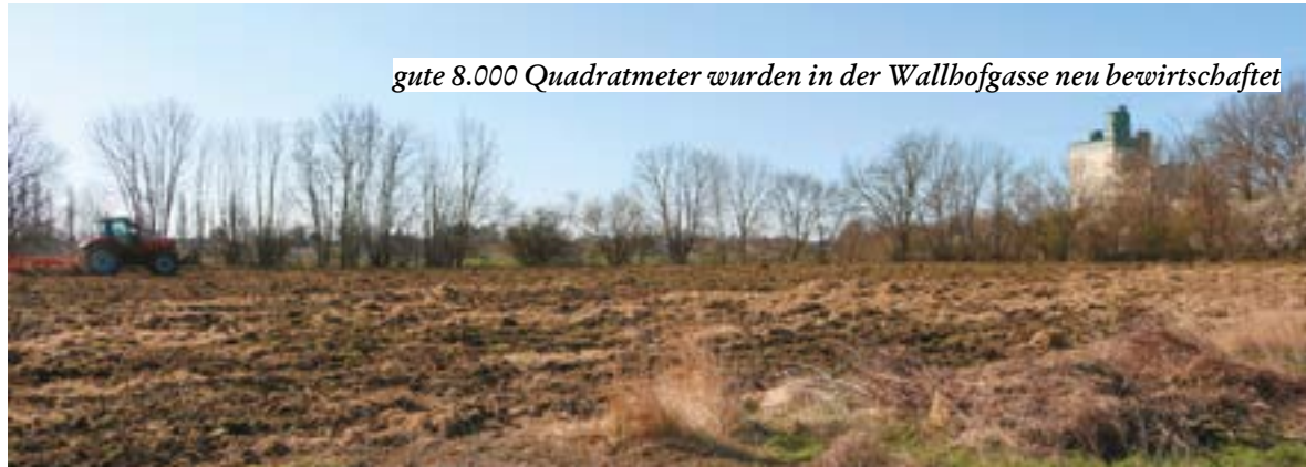
gute 8.000 Quadratmeter wurden in der Wallhofgasse neu bewirtschaftet