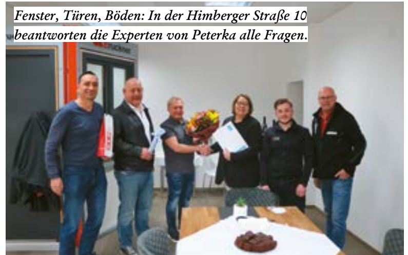
Fenster, Türen, Böden: In der Himberger Straße 10 beantworten die Experten von Peterka alle Fragen.

Dienstag: 14 bis 18 Uhr, Mittwoch: 9 bis 12 Uhr, Freitag: 9 bis 12 und 14 bis 18 Uhr, Samstag und Sonntag: 9 bis 12 Uhr.