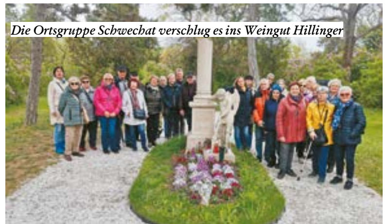
Die Ortsgruppe Schwechat verschlug es ins Weingut Hillinger

ten Informationen erfuhren die Besucher:innen alles Wissenswerte über unser Trinkwasser. Zum Ausklingen ging es in das Gasthaus „Kaminstubn“ in Mannswörth. Alle Teilnehmer:innen waren sich einig: „Ein sehr schöner und gelungener Nachmittag!“