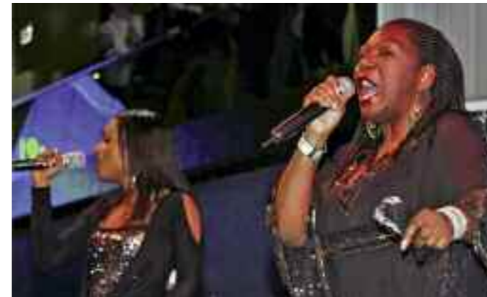
BoneyM mit Frontfrau Liz Mitchell begeisterten das Publikum bei der Multiversum-Eröffnung.

• Mai: Der Sicherheitsbeirat organisiert wieder ein Fahrersicherheitstraining für motorisierte ZweiradfahrerInnen. Der Kulturwanderweg „Ideenreich“ wird eröffnet; die Stadt nimmt mit einer eigenen Initiative den