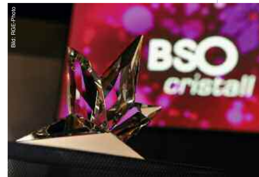
Mit diesem „BSO Cristall“ wurde die SVS ausgezeichnet. Lesen Sie dazu einen ausführlichen Bericht im beiliegenden „Sportsfreund“.