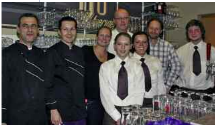
Das Team des neuen Lokals im Culinarium

Neues Lokal Anfang Dezember eröffnete im Culinarium am Hauptplatz ein neues Lokal. Statt fernöstlicher Kost wie bisher herrscht dort nun gediegene Wirtshausatmosphäre mit dem entsprechenden Angebot. „V8 bieriger+more“ heißt das neue gemütliche Lokal mit Bierspezialitäten und Hausmannskost. ***