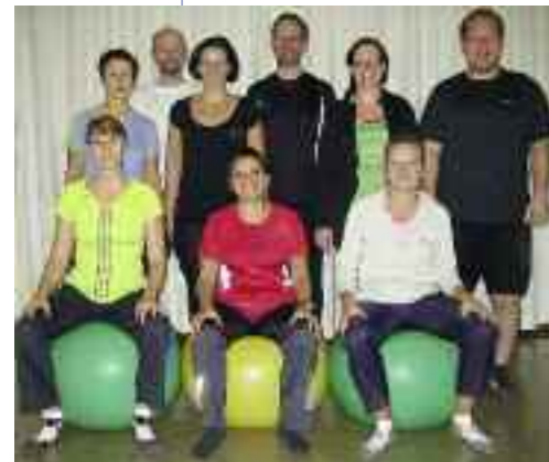
Rücken Fit heißt es ab 2012 wieder beim CLUBA.

Alle Infos auch im Internet unter http://cluba.at ■