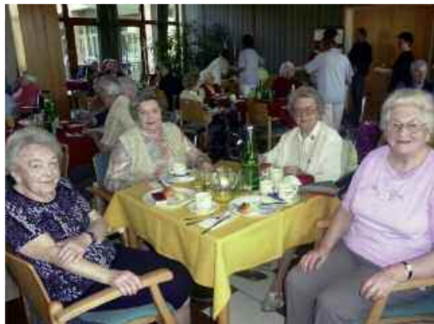
Im Seniorenzentrum Schwechat stimmt die Qualität