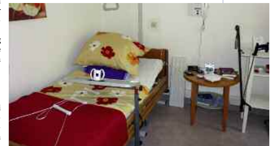
Ein Blick in die Demo-Wohnung des SeniorInnenzentrums

*** Anmeldung zur Führung: 01/706 35 05-903; Ulrike Barta ■