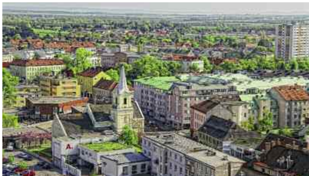
2012 wird ein gutes Jahr für Schwechat. Die Weichen dafür wurden mit dem Budgetentwurf gestellt.

Fazekas: „Wir werden 2012 auch viele fröhliche Anlässe finden, die Grund zum Feiern geben. Da denke ich an die 40. Nestroyspiele, an das Jubiläum der Partnerschaft mit Alanya und einiges mehr. 2012 wird ein gutes Jahr für Schwechat.“