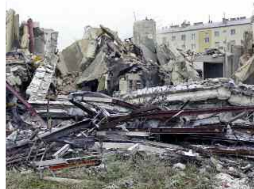
Am alten Brauereigelände herrscht rege Abbruchtätigkeit.

Einige Gebäude auf dem Gelände stehen unter Denkmalschutz, diese bleiben natürlich erhalten. ■