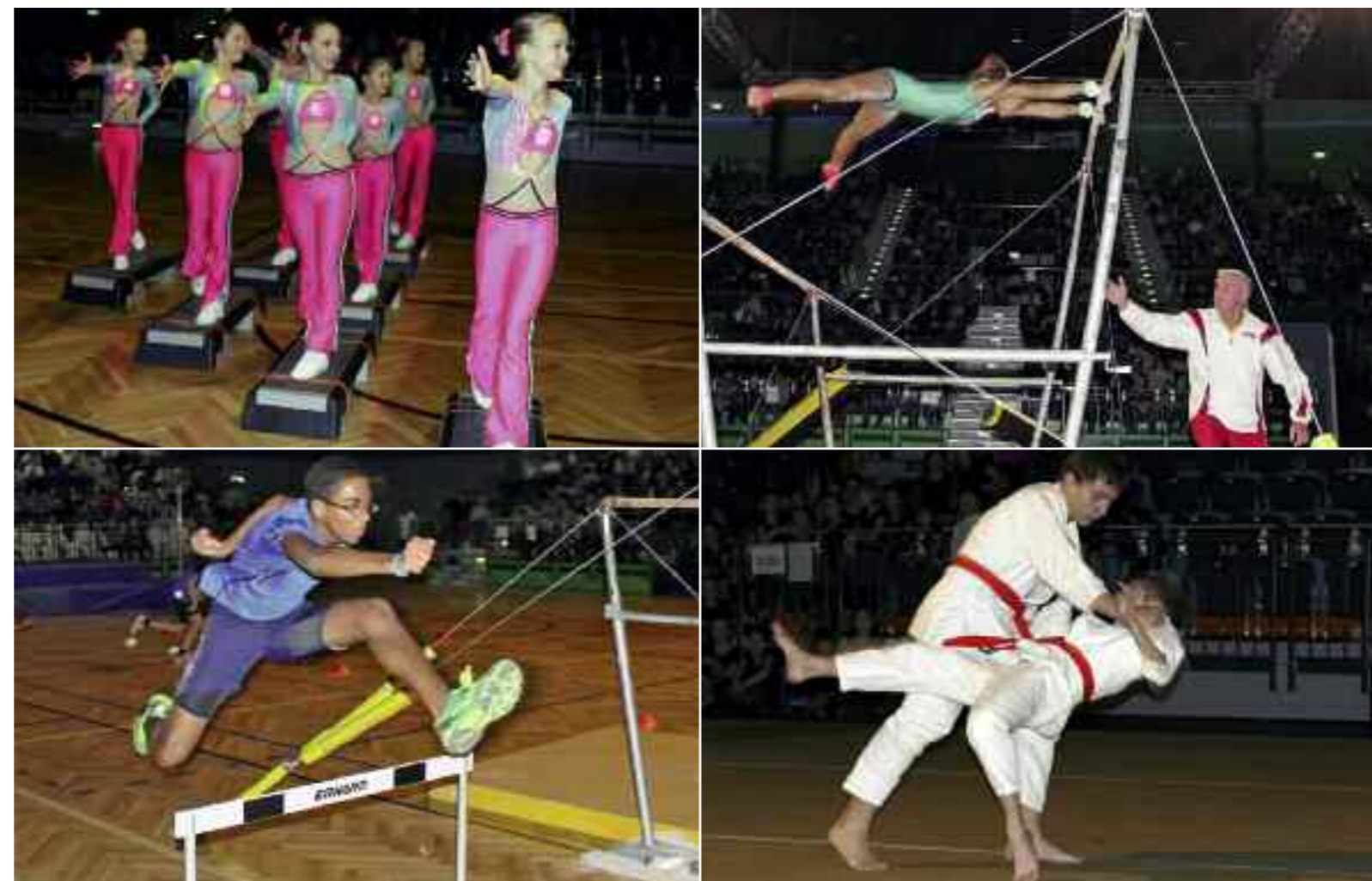
... bei der alle Beteiligten zeigten, dass Sport, Bewegung und Fitness Spaß machen – und dass Schwechat zu Recht die Sporthauptstadt Österreichs ist.