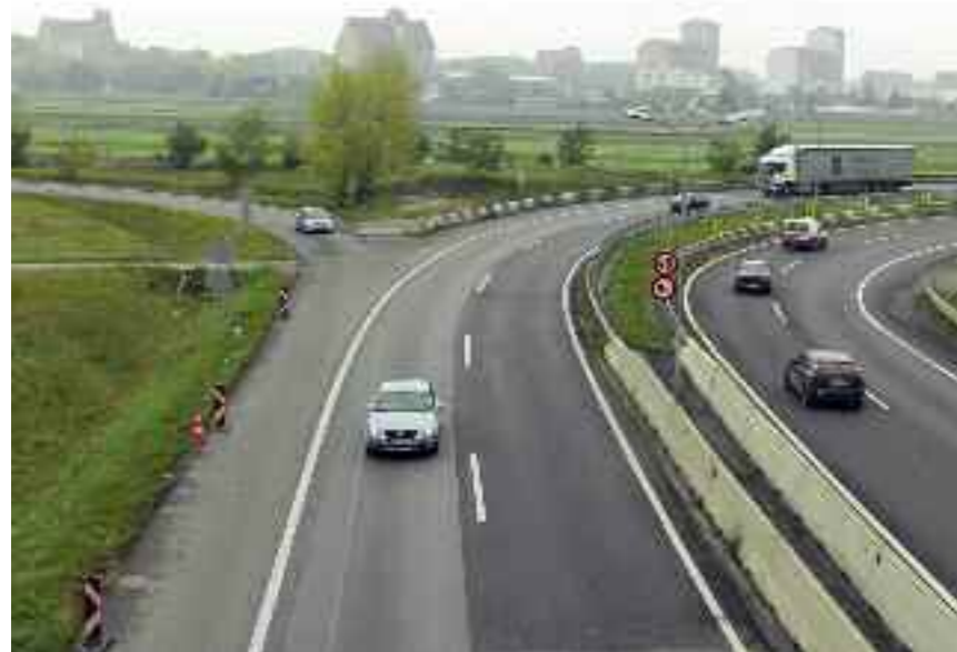
Hier soll die S1 richtung Norden weitergebaut werden.

Die Stellungnahme wurde mit den Stimmen aller Gemeinderats-Parteien angenommen und wird nun an die zuständige Umweltbehörde weitergeleitet. ■