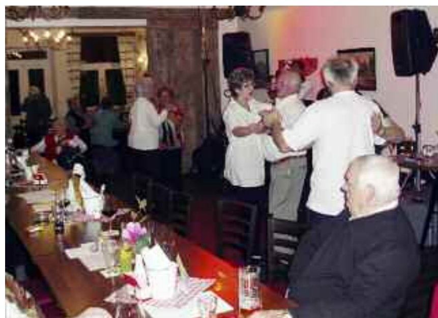
Die Rannersdorfer SeniorInnen veranstalteten einen „Tanz in den Fasching“, bei dem sich rund 60 Gäste bestens unterhielten.

Pensionistenverband, Ortsgruppe Schwechat Die Apfel- fahrt in die Südsteiermark war ein voller Erfolg, eine Fahrt durch die Weingärten vermit-