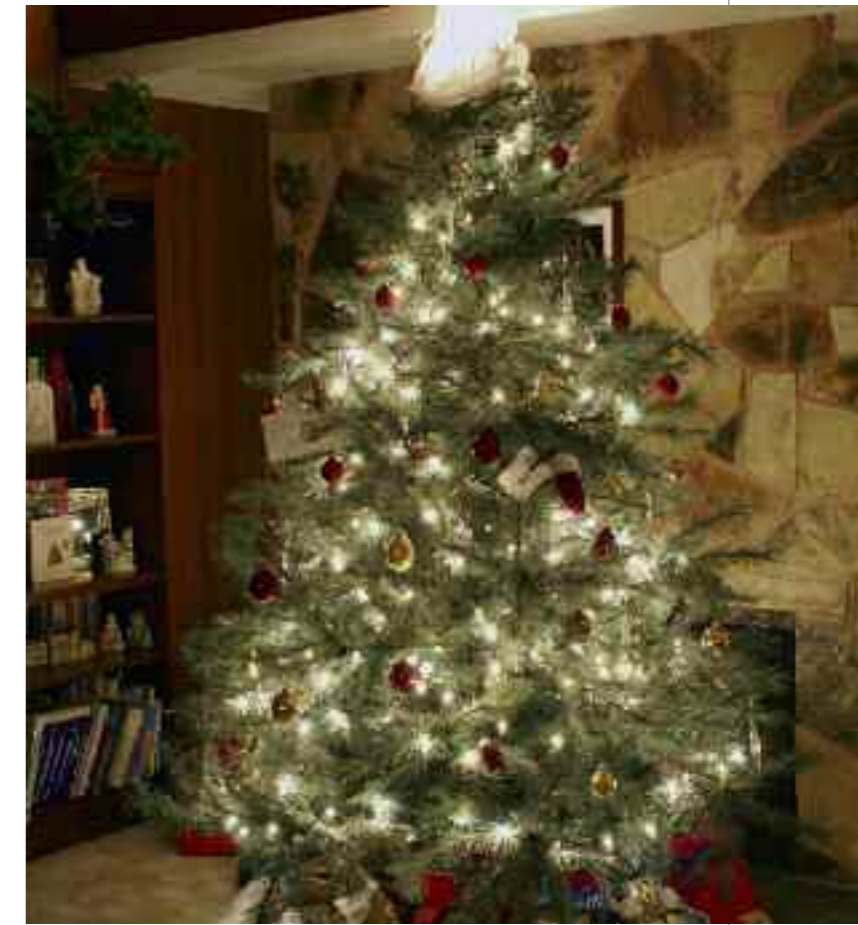
Am sichersten sind Weihnachtsbäume mit E-Beleuchtung