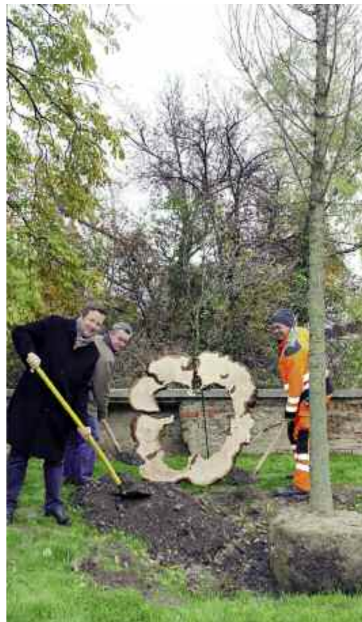
Bürgermeister NR Hannes Fazekas gemeinsam mit der Stadtgärtnerei bei der Baumpflanzung. Im Hintergrund ist der Querschnitt der alten Kastanie zu sehen.

Mit dabei auch ein Querschnitt der alten Kastanie. Fazekas: „Es wird lange dauern, bis die Ulme diese Mächtigkeit erlangen wird. Aber deshalb wurde sie ja auch gepflanzt – sie ist ein Symbol für die Nachhaltigkeit, mit der Umweltschutzbetrieben werden soll.“