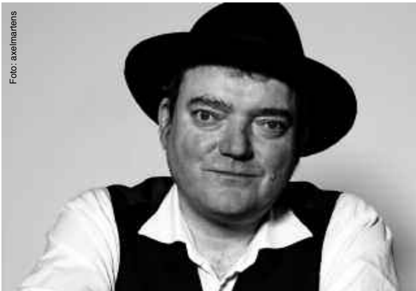
Wiglaf Droste kommt zum Satirefestival.

Am 18. Jänner 2012 fällt im Theater Forum der Startschuss für die elfte Auflage des Schwechater Satirefestivals. Ein Jubiläum kann man damit allemal begehen: das Theater Forum wird dann 20 Jahre alt.