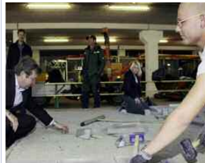
In der Überbetrieblichen Lehrwerkstätte Schwechat begann der dritte Ausbildungsturnus.

• Dezember: Im Multiversum findet zum zweiten Mal die Jugendgala statt. Das Budget 2012 wird dem Gemeinderat zur Beschlussfassung vorgelegt und für den Schwechater Adventmarkt wird erstmals der Hauptplatz für den Verkehr gesperrt.