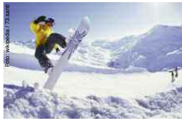
In Spityl am Pyhrn warten Ski- und Snowboard-Spaß

mit einer Kopie von Meldezettel, E-card, Schüler-/Studentenausweis, Lehrvertrag. Alle Infos: Martina (Ski): 0664/3540383 (18 bis 21 Uhr); René (Snowboard): 0664/8480881 (18 bis 21 Uhr); Jugendinfostelle der Stadtgemeinde, b.hutter@schwechat.gv.at, Tel: 01/701 08 -301. ■